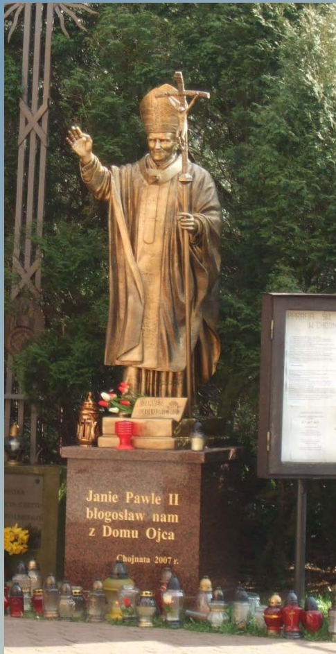
Pomnik Jana Pawła II